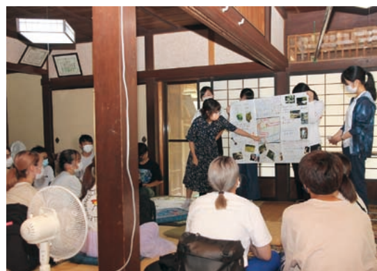
写真やイラストを交えて発表