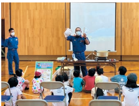
ポリ袋調理の様子

その後、避難所で簡単に調理できるポリ袋を使った料理や、小学校に配備されている防災倉庫の資器材について紹介しました。最後はプールに移動して着衣泳法の訓練を行いました。「浮いて待て」をキーワードに、もし水の事故に巻き込まれたときにどうやって助けを待つか、身近な物でどのように助けるかを小学校のみんなで訓練しました。