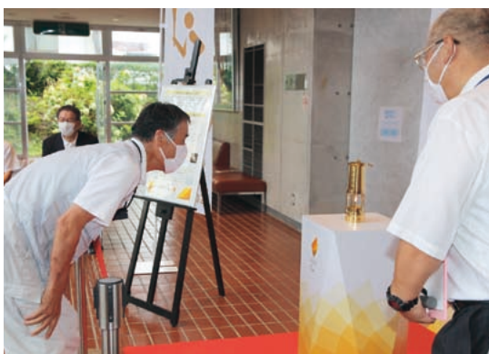
聖火を間近でみる来場者

14日には、採火された「中予の火」が本町を訪れ、産業文化会館でパラリンピック聖火として展示。訪れた来場者は、間近で見たり記念撮影をするなど楽しみました。