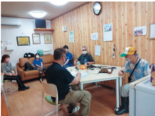
ゆっくり過ごせる交流スペース