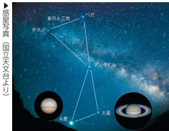
▶惑星写真

す。その厚さは数百km程と薄く、麦わら帽子を彷彿とさせる夏にぴったりの天体です。 土星より東に輝く明るい星が木星です。大きさは地球の11倍程で太陽系最大の惑星です。自転周期（一回転する時間）は約10時間と早いため東西方向に凄まじい強風が吹き、ガスの雲が流れているために縞模様が見えます。 明るい金星、土星の環、木星の縞模様は望遠鏡を使うとよく見えます。天体観測館の観望会で見るができますのでぜひ見に来てください。 (重藤)