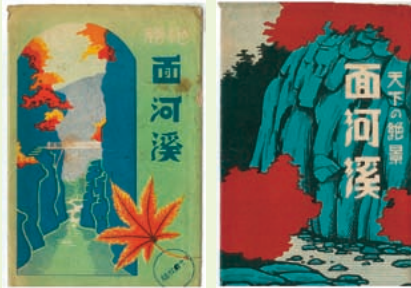
戦前の観光絵葉書(袋)

【期 間】 10月2日(土)～ 11月28日(日) 【入館料】 一般300円、小中150円 【問い合わせ先】 面河山岳博物館 ☎58-2130