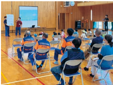
避難の仕方などの説明を聞く皆さん