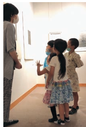
◀作品解説を熱心に聞く子どもたち