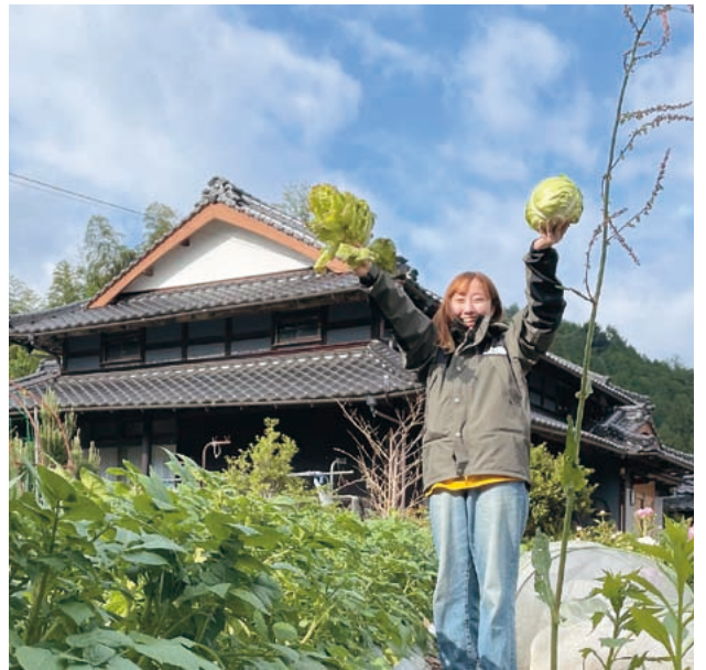
記念すべき初収穫（キャベツとレタス）

しく料理もはかどります。最近「使わない畑がある」という住民の方のつぶやきをお聞きしました。その畑を活かし「植える・お世話・収穫・調理・食べる」の一連の流れを、住民の方に先生になっていただき町内の子どもたちに体験してほしいと思ったので、食育・多世代交流ができるよう今後活かしたいと思います。