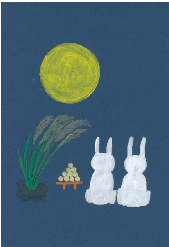
カット 近藤 万里