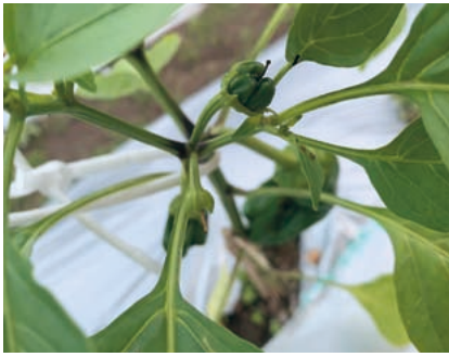
可愛いピーマンの赤ちゃん

昨年の秋に久万高原町にUターンしてきてやりたかったことの一つに家庭菜園があります。地域の方々に教えてもらいながら数種類育てて