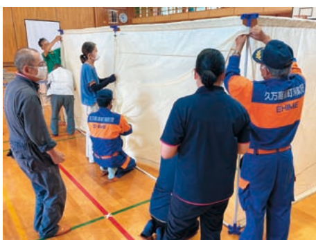
参加者全員で間仕切りの組み立て