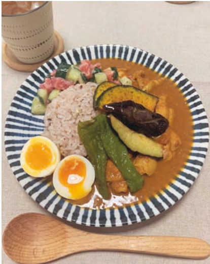
収穫した野菜で夏野菜スパイスカレー

いますが、こんな育ち方するんだ！とか、花が咲くんだ！と日々初めて知ることが多く面白いです。収穫するのも楽