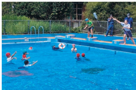
プールで着衣泳法訓練

災害はいつどこで発生するか分かりません。これからも訓練や防災指導を通じて皆さまと一緒に久万高原町の防災力を高めていきたいと思えます。