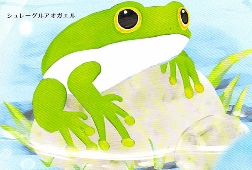
シュレーゲルアオガエル