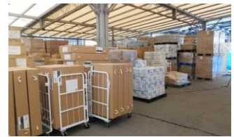
(能登半島地震 物資拠点)

○最大規模の災害における想定避難者数に対して 必要となる備蓄量 (最低3日間、推奨1週間) と市町により備蓄される量とを勘案し不足が懸念される物資や、市町の区域を越えた利用が想定される物資を備蓄するよう努める