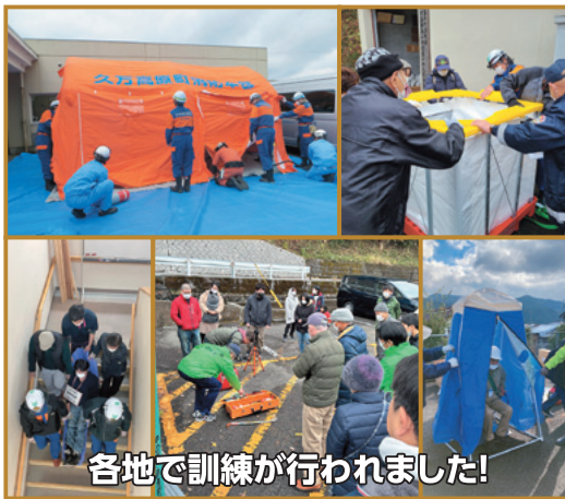
各地で訓練が行われました!

中、高齢者などへの避難誘導や 安否確認には、自主防災組織の 協力が必要であり、要配慮者利 用施設では、人命救助に時間を 要することから消防団への出動 要請は必須です。 南海トラフ巨大地震が発生す ると、本町では震度6強の揺れ になると言われています。災害 発生時には、町職員だけではす べてに対応することはできません。 「自分の命、自分の地域は 自分たちで守る」という意識を 持っていたいただき、日頃から隣近 所の高齢者、近隣の施設への声 掛けを心がけ、災害を乗り越え るために何をすべきか考えて いただけたらと思います。