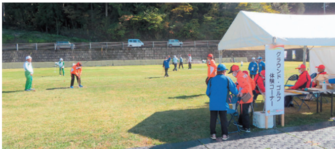
グラウンド・ゴルフ体験コーナー