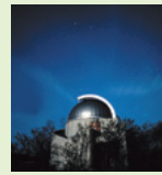
天体観測館 天文台