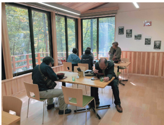
清流の眺めが美しい軽食喫茶スペース