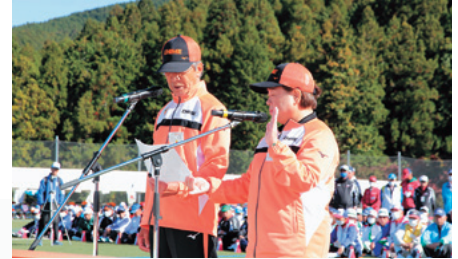
愛媛県選手代表による交流宣言