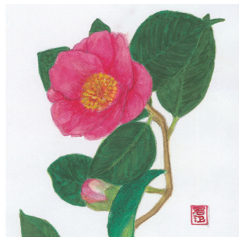
カッタ 古味 君江