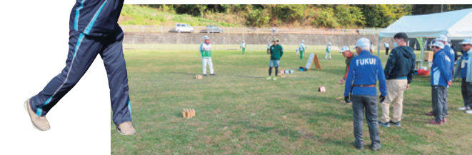
モルック体験コーナー