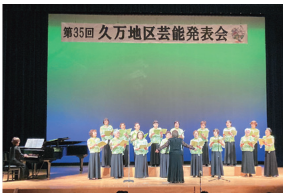
コーラス風の皆さんによる合唱

久万山五神太鼓・川瀬歌舞伎をはじめとした伝統芸能による圧巻の演技や、海棠流くま・縁舞など多くの子どもたちによる一生懸命な演技は、観客を一層沸かせました。