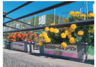
歓迎のぼり旗、プランター