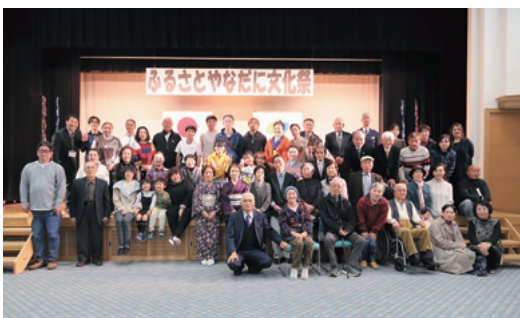
文化の火(日) 守り育てる 文化祭