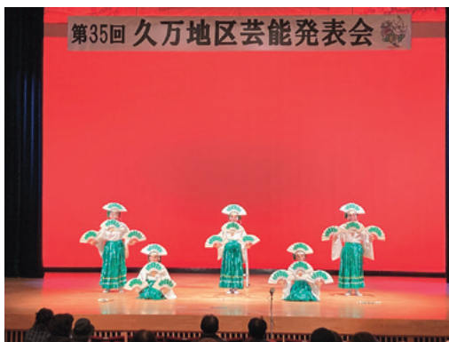
明神万歳保存会「松づくし」