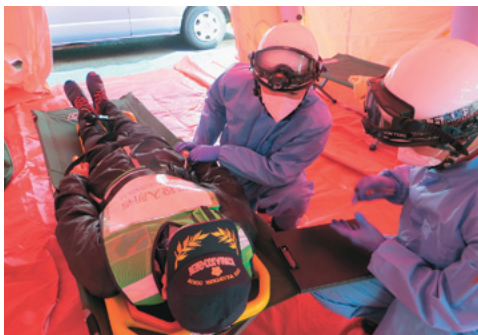
要救助者をトリアージする様子