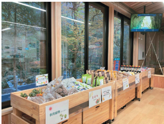
地元特産品の販売コーナーや面河溪を紹介するデジタルサイネージ