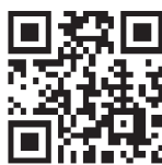
確定申告書等作成コーナーはこちら!