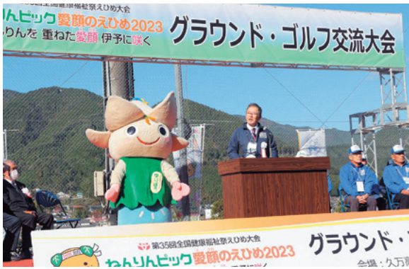
大会長(町長)あいさつ