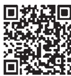
マイナポータル連携の詳細についてはこちら!