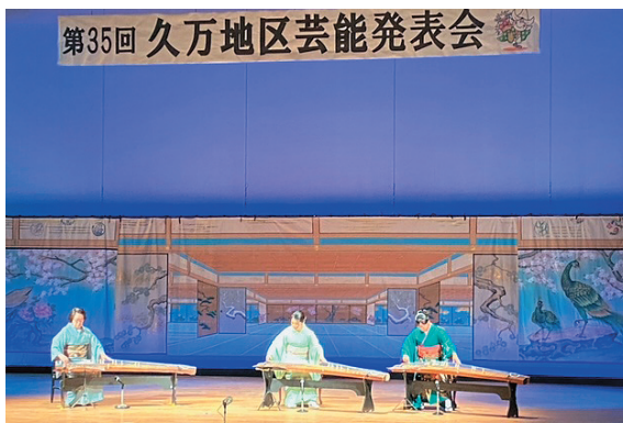
新崎社中（箏）「六段の調」