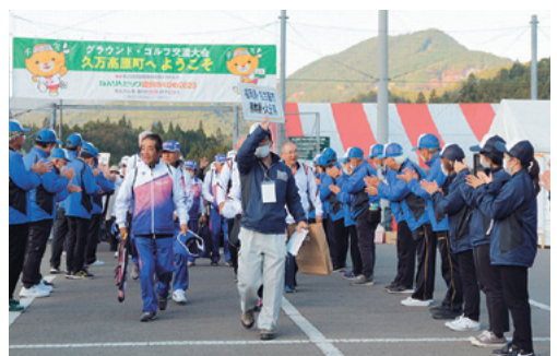
スタッフみんなで選手のお見送り

本大会には久万高原町から男性4名、女性2名、計6名の選手が出場し、日頃の練習の成果を存分に発揮しました。また、ボランティアなどによる体験コーナーの運営、町生活研究協議会によるおもてなし料理の提供、企業の皆さまによる協賛・協力、町民の皆さまによる応援など、多くの皆さまのご協力により、心のこもったおもてなしができました。ご支援、ご協力いただきました。ご支援、ご協力いただきました。心からお礼を申し上げます。