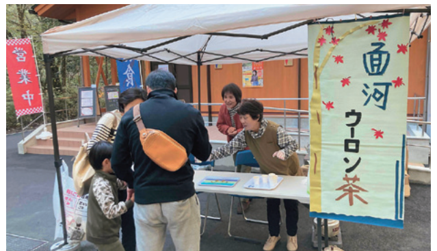
地元面河地区の皆さんも活躍