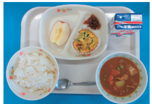
給食：11月7日提供のトマト入りポークカレーライス