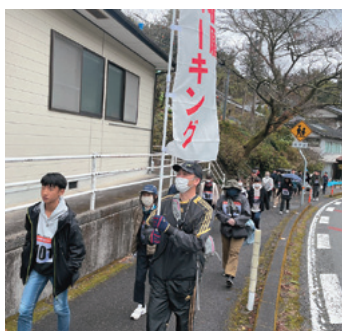
受験もウォーキングも小さな1歩の積み重ねです

参加者からは「自然にたくさん触れてリフレッシュできた。西谷地域の方の気遣いがうれしかった。合格に向けて頑張りたい」との声が聞かれました。