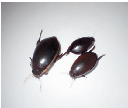
▲ゲンゴロウ(左)、クロゲンゴロウ(右上)、コガタノゲンゴロウ(右下)。どれも2cm以上ある大型種です

皆さんは「ゲンゴロウ」を見たことがありますか？ゲンゴロウは体長4cmを超すこともある大型の水生コウチュウで、泳ぐ姿は迫力満点です。愛媛では約40種のゲンゴロウの仲間が確認されていますが、そのほとんどは体長10mm以下。2mmクラスも珍しくない、小さな種ばかりです。そんな中、破格の巨大種とも呼べるこの虫は、全国的に個体数が激減し、愛媛県からは30年以上見つかっていません。県内ではこの他に20種のゲン