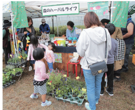
買い物を楽しむ親子連れ