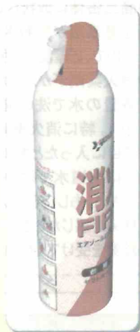
■対象商品(自主回収) 【ヤマトボーイKT】

弊社では、これまで皆様のご協力を得て自主回収を推進してまいりました。しかし、2017年で製造から15年が経過しておりますが、まだ多数の消火具が残っている可能性が高く、事故防止を図る観点から、今後とも皆様方のご協力を得て一層の回収・廃棄に努めてまいります。