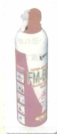
■対象商品(自主回収) 【FMボーイK】