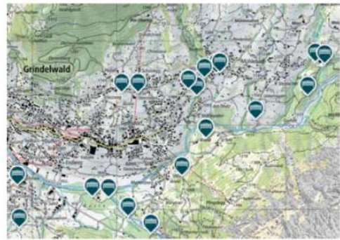
設置場所の選択マップ