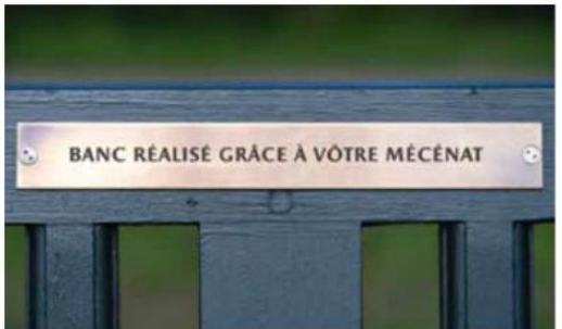
ネームプレート(意味は「あなたの寄付によって実現したベンチ」)