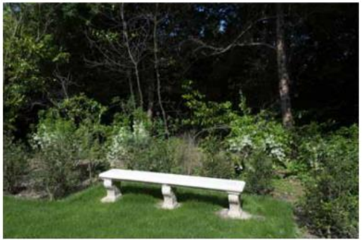
実際に設置されたベンチ