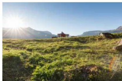
尾根に設置されたベンチ