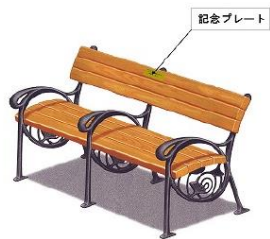
設置されるベンチの一例