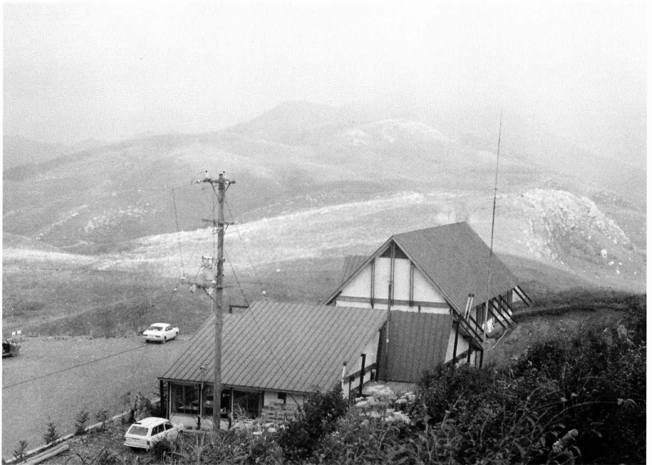
地芳荘落成 昭和41年4月6日