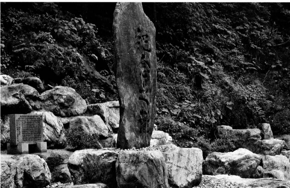
記念の滝記念碑移転除幕式 昭和51年8月7日