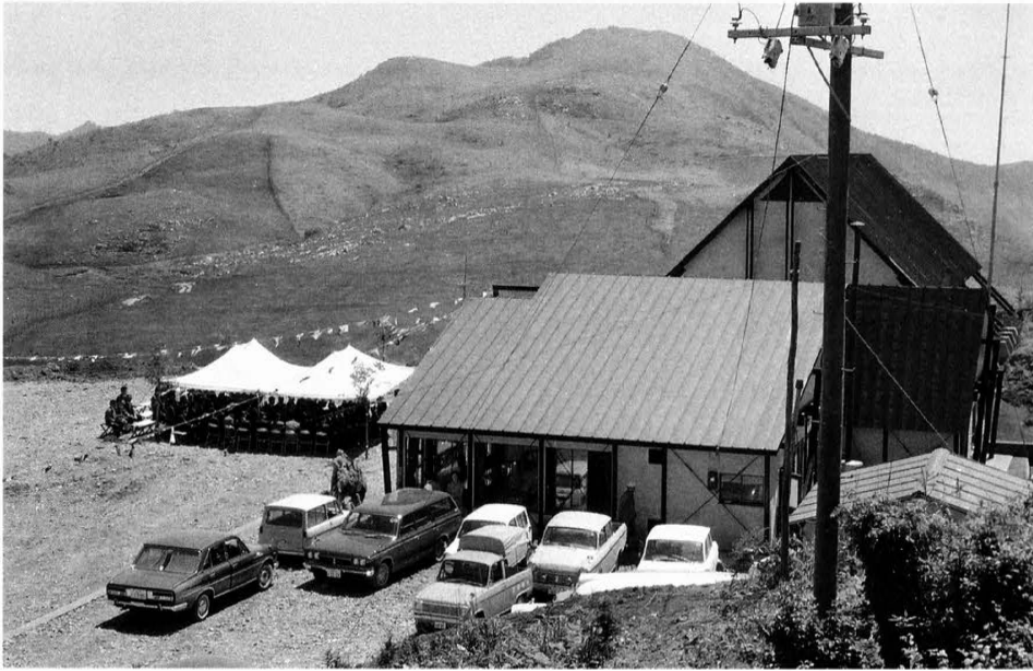
産業会館姫鶴荘落成 昭和44年6月10日