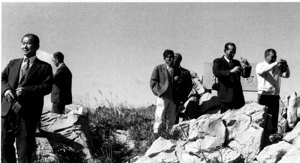
県文化財巡視員、 八釜・四国カルスト視察 昭和52年11月11日