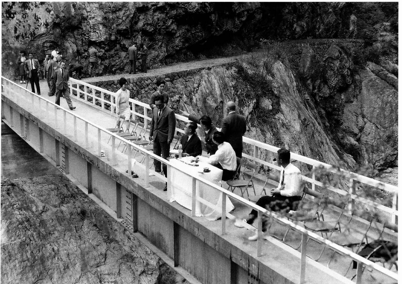
高松宮殿下八釜溪谷視察 昭和41年5月1日