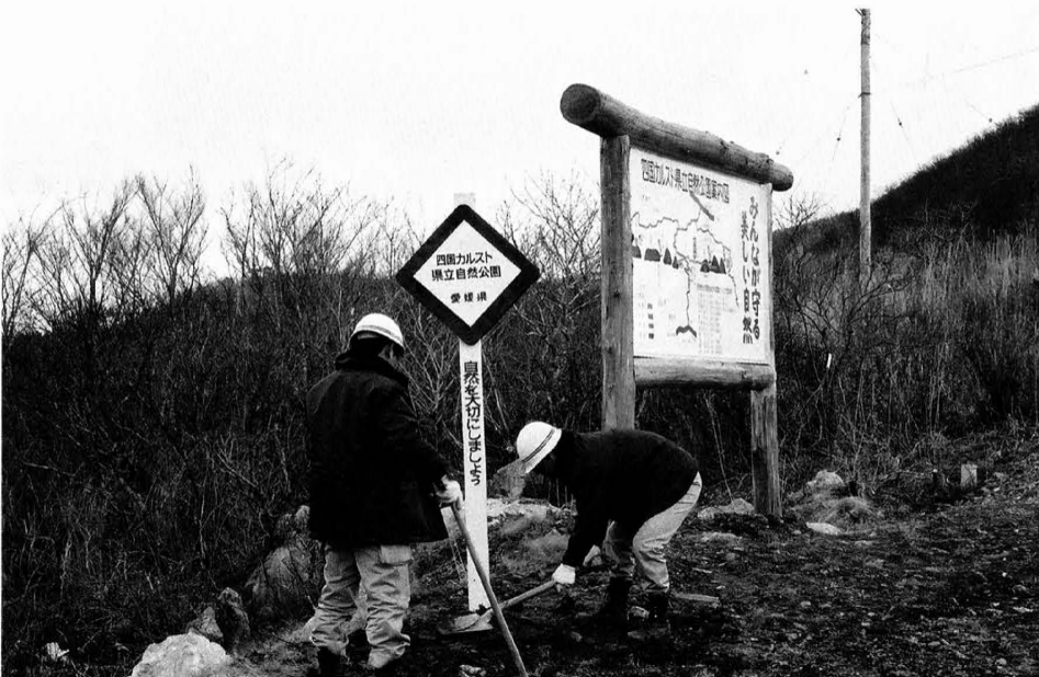
西谷、八釜地区自然保護看板設置 昭和49年4月2日