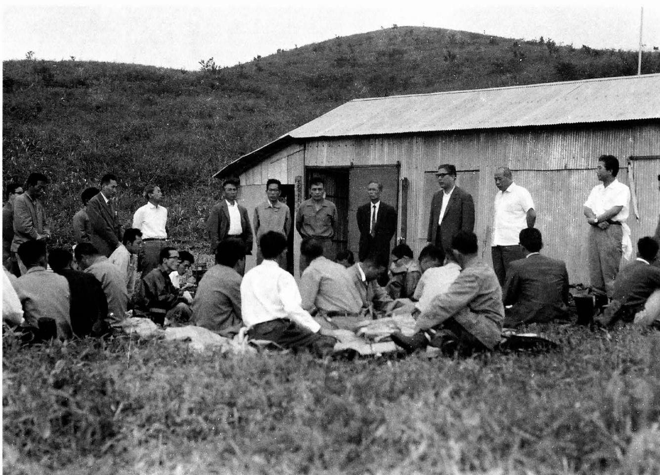
姫鶴放牧管理小屋落成 昭和40年6月2日