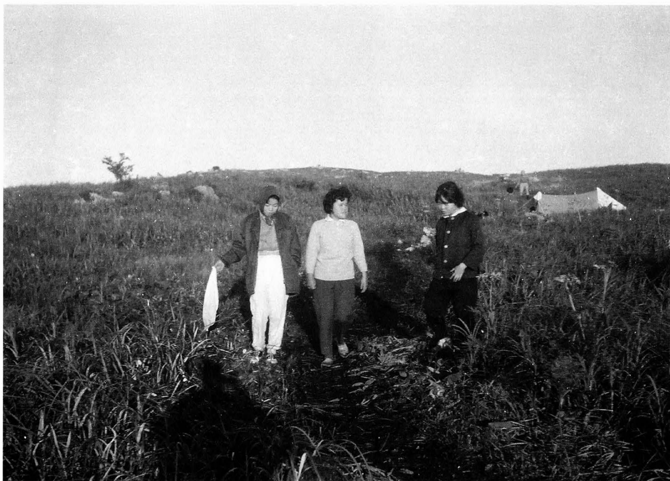
四国カルスト県立自然公園開園 昭和39年7月17日