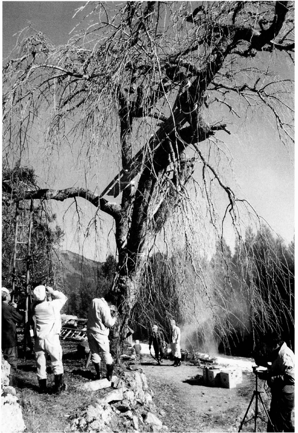
西村大師堂しだれ桜周辺奉仕作業 平成8年12月3日