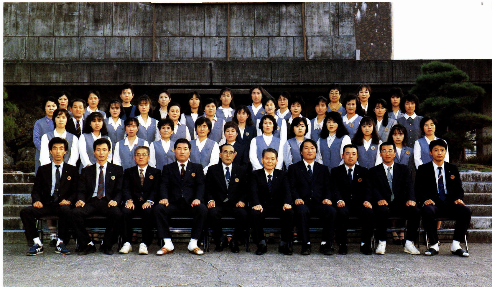
教 育 委 員 会 職 員