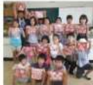
編ゴムを使って、模様をつけます。

さあ、どんな色になるのか？あなただけのオリジナルハンカチを作ります。お楽しみに！