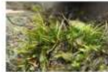
マツボックリ(袋根帯の噴水岩壁)

今回のモモンガクラブでは、春の道沿え関門をのんびり歩いて、そんな動植物の観察をしてみましょう!