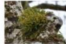
スズランシダの仲間、夏草帯の絶滅危惧種