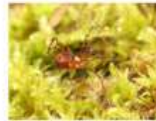
夏草帯の下にすむニホンアマガサムシ