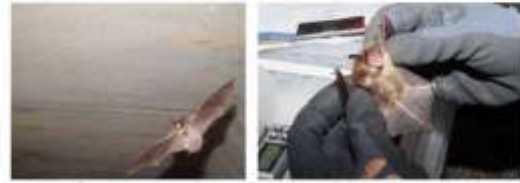
人工の光源もとむモロコフコウモリ