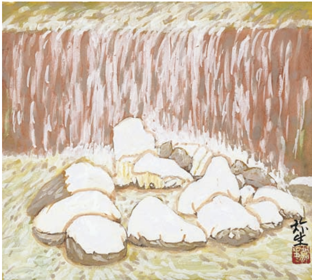
カット 古谷 弥生