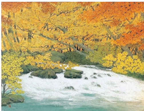
寄贈のあった絵画 那波多目功一《奥入瀬の秋》

創作こけしは、現在まちなか交流館展示室で展示しており、絵画については別途絵画展の開催を予定しています。