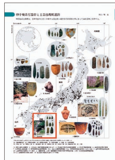
◀季刊考古学153(絵ページ) 〔赤枠が上黒岩岩陰遺跡の神子柴系石器群〕

縄文時代の人々の移動手段は限られていました。車や電車はもちろんメールやFAXもない時代に、日本列島にどのような情報ネットワークが構築されていたのでしょうか。約1万5千年前の情報伝達能力に改めて驚かすにはいられません。 (遠部)