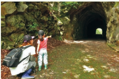
「親子で遊ぼう! わくわく自然たんけん隊」実施の様子

を観察して、つんつん触って誇らしげに笑ったり:。終了後のアンケートでは「いろんな生き物の知識を得られた」「近場の自然の楽しみ方が分かった」という声が多く、今回の事業を通して、親子双方の自然観に良い影響を与えることができたと感じています。 来年は協力隊の任期最後と博物館開館30周年という節目の年。子どもから大人まで、久万高原町の自然や文化を知り、親しむきっかけになるような展示やイベントをたくさん実施していきたいと思っています。ぜひご期待ください!