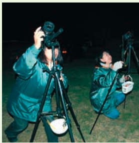
宙(そら)ガールの観測会