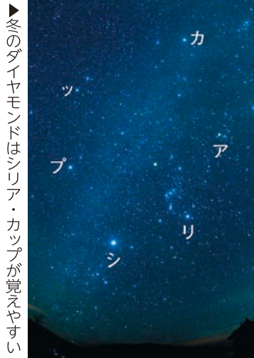
▶冬のダイヤモンドはシリウス・カップが見えやすい

冬は1等星が多いため星や星座探しに適しています。小学校4年生の理科で習うオリオン座や冬の大きな三角がよく見えます。 冬の1等星は7個見えます。オリオン座のベテルギウスとリゲル。おうし座のアルデバラン。ぎよしゃ座のカペラ。ふたご座のポルクス。こいぬ座のプロキオン。おおいぬ座のシリウスです。ベテルギウスを除く6個