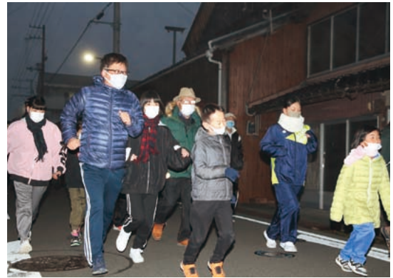
マスク着用で走る参加者の皆さん