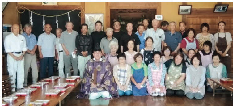
▶自治会の皆さん ▼集落の全景

久万の大除城の出城のひとつとしてこの地にあったと記録に残っています。地元では通称「三訪山」の愛称で呼ばれています。山の頂上までに三カ所の祠があり、毎年度の整備をしながら祠を祀り地域住民の安全と健康を祈願しております。 仲組自治会の良いところは、年配の方々が年下の意見を尊重してくれて、意見や提案が言いやすいところです。