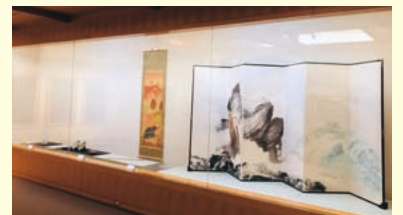
現在の展示風景 長谷川竹友《霊峰石鎚》(愛媛県美術館蔵)