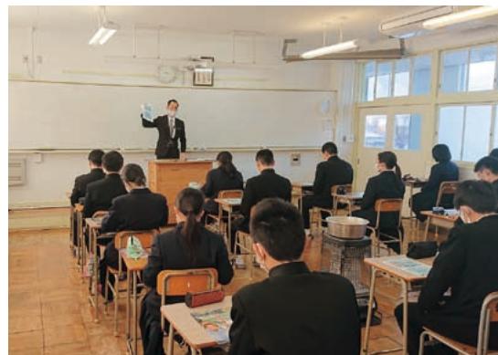
興味深く耳を傾ける普通科の生徒たち

昨年度に引き続き2回目で、農業の課題や将来性などを分かりやすく説明した後、全国から農業研修生を受け入れている久万農業公園の現状を紹介し、生徒には、将来久万高原町に帰って農業をすることも選択肢の一つに考えて、とPRしました。