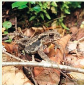
二ホンヒキガエル