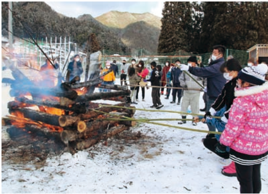
お焚き上げの炎でお餅を焼く参加者の皆さん

また、竹竿に挟んだお餅をお焚き上げの炎で焼き、焼いたお餅は感染症対策のため各自で持ち帰って食べました。