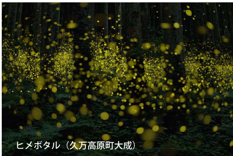
ヒメボタル (久万高原町大成)

この講座ではプロの昆虫写真家をお招きし、愛媛と久万高原町で見られる美しいホタルの乱舞と星空の風景を素晴らしい写真と共に紹介します。撮影技術の解説、そして撮影時のマナーもお話いただきます。