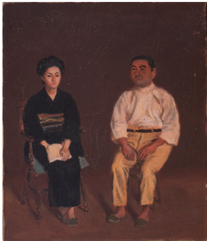
伊丹万作《市河夫妻之像》1924~25年

■今秋の企画展「シュらん2017」は、現代作家3人の展示が中心ですが、『朱欒』（全9冊）の実物展示と《市河夫妻之像》も展覧する予定です。『朱欒』と「シュらん2017」の時空をまたいだ作品のコラボレーションがお見せできれば…！と日々準備中です。