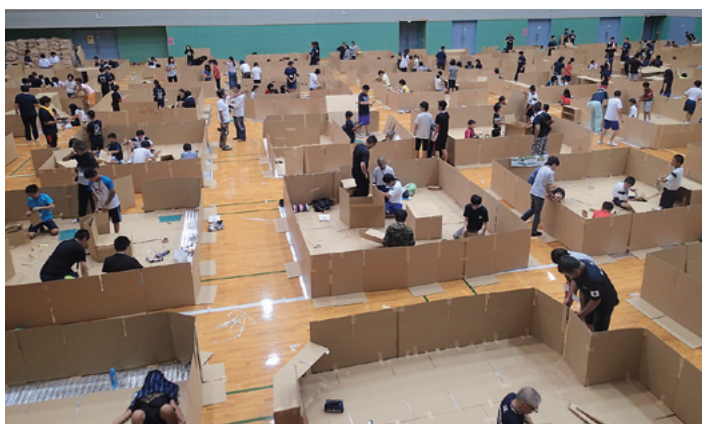
段ボールで仕切りを作り、寝床を確保する体験活動の様子