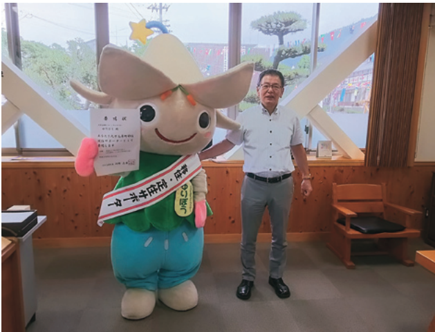
第1号としてゆりぼうに移住定住サポーター（イメージアップサポーター）を委嘱

サポーターは、活動の内容や場所により「地域サポーター」「施設サポーター」「応援サポーター」「イメージアップサポーター」として活動していただく予定です。