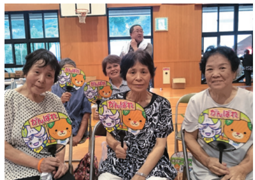
夏祭りを楽しむ地域の皆さん

柳井川分館が毎年開催しているもので今回が19回目。今年も地域内外から100人を超える来場者があり、参加者からは「毎年、この日にみんなと会えるのを楽しみにしています」といった声も聞かれ、訪れた人は8月最後の週末を楽しんでいました。