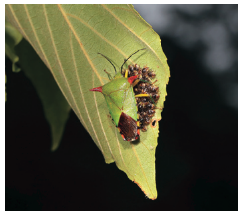
◀2齢幼虫を守るオオツノカメムシ

もう1回脱皮するまでのさらに1週間、子どもたちを守り続けます。子守を終えらるとメスは力尽きて死んでしまうという推察されますが、詳しい生態はまだまだ分かっていません。卵を少数ずつ産みつぱなしにするより、一カ所にたくさん産んで大きくなるまで守る、このような繁殖戦略をとるようになった進化の過程はとても興味をそそられます。 博物館の横には高さ10mを超えるケンポナシがあり、テラスから葉が茂っている樹冠部が目の前。これほど彼らの観察に適した場所は国内にほとんどありません。