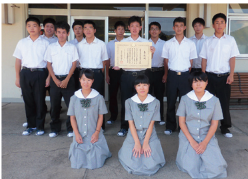
受賞した上浮穴高等学校農業クラブの皆さん

農業クラブは、少子高齢化が進む久万高原町で、森林環境を学び継承し、町産材やクモジなどの地域資源を活用した地域活性化に寄与する多岐にわたる活動が評価されました。