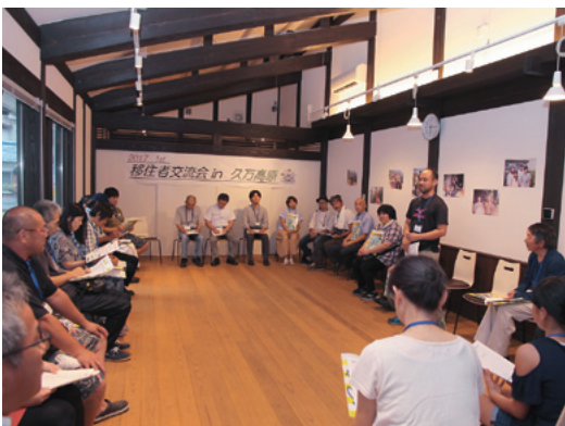
意見交換会やバーベキューが行われた交流会の様子

第2回は、11月に開催予定の「森のハートライフ」の中で、「移住フェア」を行う予定です。