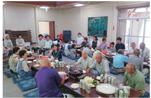
作業後に懇親を深める参加者の皆さん