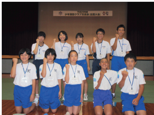
交流会に参加した中学生の皆さん