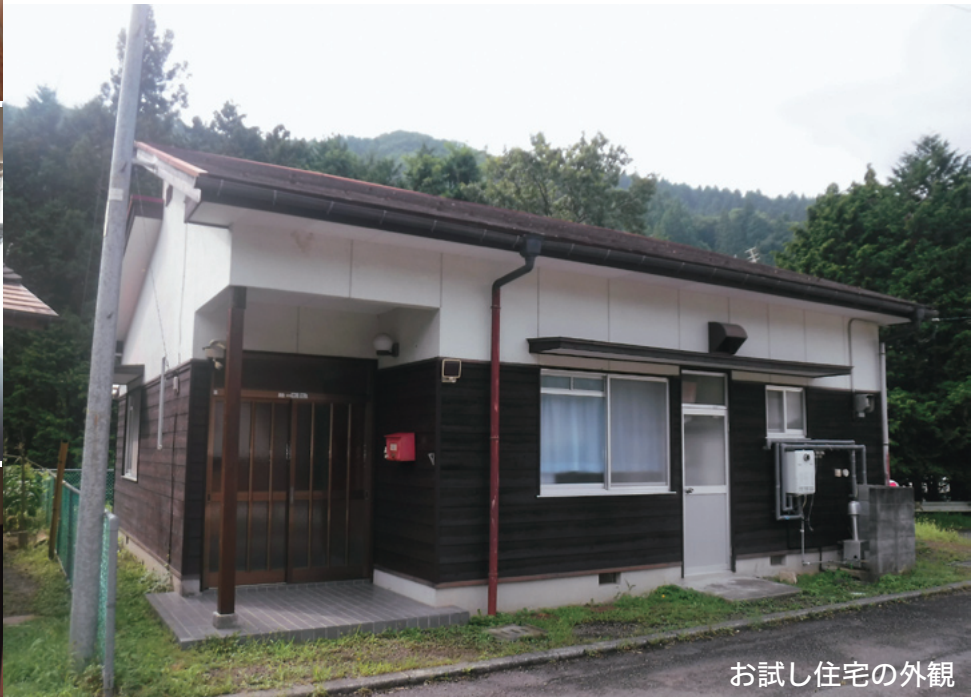
お試し住宅の外観