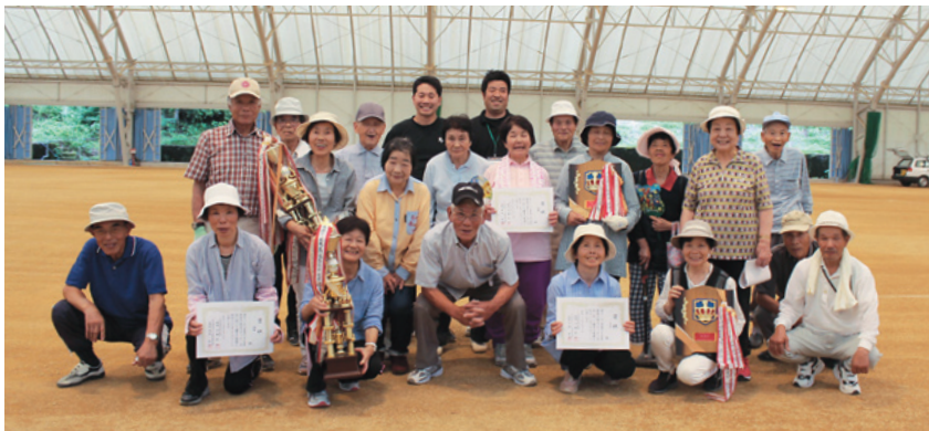
今年も元気にプレーした選手の皆さん