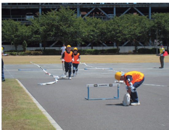
ホースを延長する訓練の様子