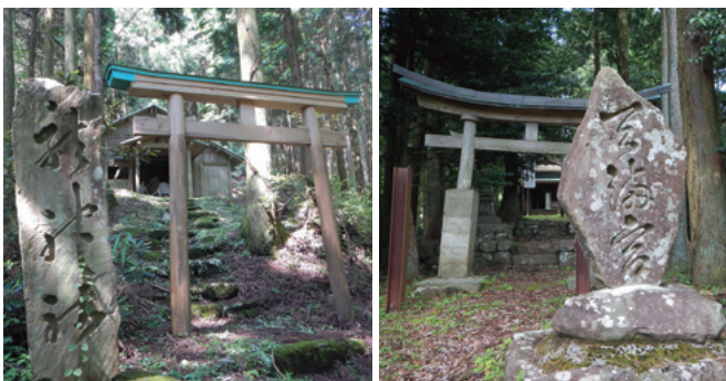
竜神さん(左)と天神さん