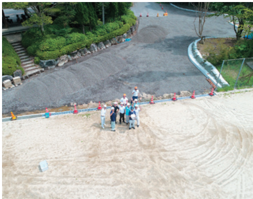
ドローンから地上を撮影した写真

今後、作業道の測量などの森林調査や山地災害の被害調査など、いろいろな用途への活用が見込まれており、実際にドローンによる起業を予定している林家もいるようです。