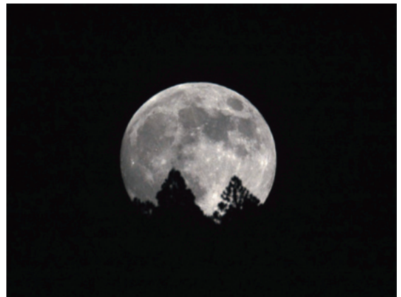
◀昇る中秋の名月（菅生にて撮影）

を愛でることが出来る年はあまり多くありません。実は中秋の夜に月にお供えをし、収穫に感謝する伝統は中国から伝わったもの。大陸では高気圧が発達し、良く晴れる時期なのです。 秋雨のシーズンが終わるのは10月上旬。旧暦で決まる中秋の日は毎年変わりますので、遅い年ほど晴天に恵まれる可能性が高くなります。今年10月4日と19年ぶりの遅い中秋。天高く（満）月肥ゆる秋、を期待したいですね。