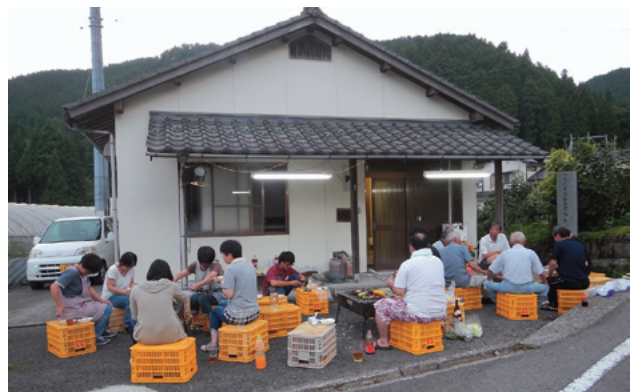
バーベキューでの懇親会の様子

行ったりした参拝記録が残っています。毎月の定例会、5月の田休みには天神さん、7月13日は竜神さんでオコモリ。7月第4土曜日は、夏祭りを兼ねて自治会でバーベキューでの懇親会を行っています。また、地域には消防団員も5人おり、地域活動にも積極的で、イノシシ対策や農道・水路補修なども協力し合っています。 戸数自体は少ないですが、若い独身者もあり、今後を期待しています。