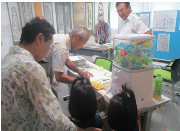
▶展示風景(何がでるかな?)

ショップ体験をしてもらいました。また、木製(ヒノキ)の遺跡地図や、遺跡グッズなども作成し、地域ならではの取り組みも行ってみました。 9月に実施する猿楽遺跡と上黒岩第2岩陰遺跡の2016年の調査成果などについても紹介することができ、この広報が届く頃にはまさに発掘調査の真っ最中です。(遠部)