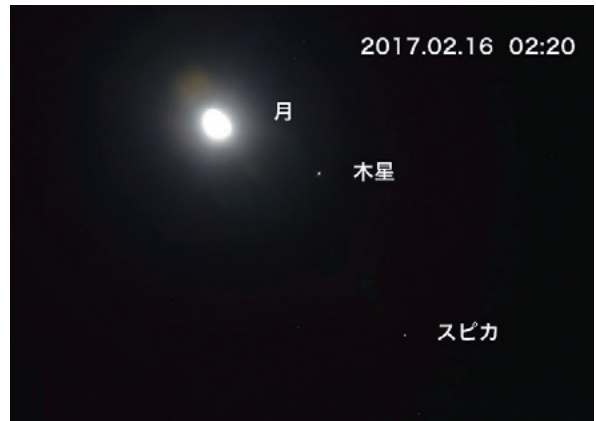
◀月と木星・スピカ

春分を迎え、いよいよ春本番。暖かくなり夜空を見上げる機会も多くなるでしょう。今年の春は木星が見ごろです。4月8日に衝となり、観望の好機です。日の入りと同時に東の空から木星が昇ってきます。空が暗くなれば明るいいため簡単に肉眼で見えますが、観測には双眼鏡を使いましよう。木星だけでなく木星の月・ガリレオ衛星を4つ見ることが出来ます。木星の周りを回っているので位置が変わったり、木星に隠れたり前面を通過するため数が変わり