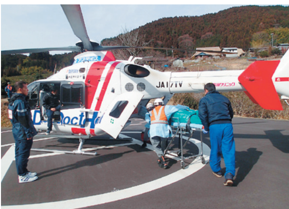
面河地区相の峰ヘリポートでの訓練の様子