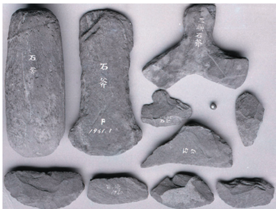
▶笛ヶ滝遺跡の出土遺物

たことはあまり知られていません。県外から何人も研究者が来町し、調査に参加しています。それから半世紀の時を経て、現在、上黒岩第二岩陰と猿楽遺跡という2つの発掘調査が行われています。この2つの調査にも、県内外から多くの方が参加し、その中には50年経ったときに、今調査中の2つの遺跡はどうなっているのでしょうか。ついつい、そんなことを考えてしまいます。(遠部)