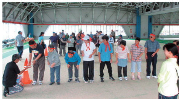
友愛のつどいの様子