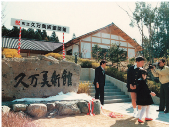
▶平成元年3月、開館時の久万美術館

しているはず。将来、合併などによって、自治体の名称に「久万」という呼び名がなくなったら、美術館の名前から「久万」が消えてしまふ可能性があります。「町立」という言葉が頭に付くのは、唐突な感じが否めませんが、「町立久万美術館」であれば、「町立」は変わっても、「久万美術館」はそのままで「久万」の二文字をずつと残したい。開館準備にかかわった人たちが抱いた想いは失せることなく、愛称「久万美」は生き続けています。(高木)