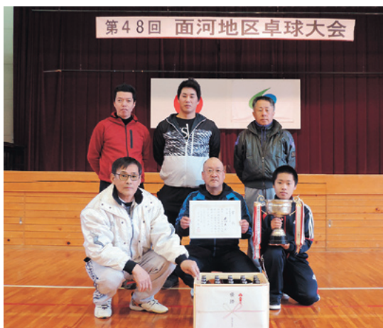
(右) 団体男子の部で優勝した若山Aチームの皆さん