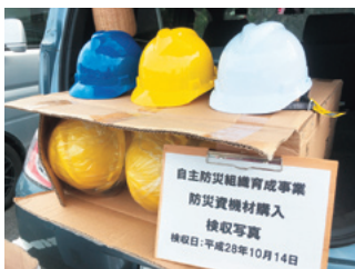
新春日台3、洪草に整備したヘルメット