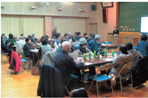
面河地区地域運営協議会設立準備委員会の様子