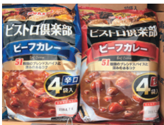
相の峰に備蓄した非常食