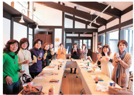
完成した人形を手に笑顔の皆さん

参加者は、クレパスなどで思い思いに和紙へ色付けし、細かな模様でカラフルなでんこ（ちゃんちゃんこ）をデザイン。切り取り・組み立てをして足元からLEDのろうそくを灯し、現代らしいでんこ人形を完成させていました。