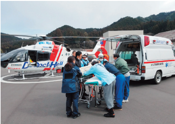
消防署ヘリポートでの訓練の様子

院に搬送しました。生命の危険がある傷病者を早期に医師の管理下におけることは、傷病者にとってはメリットであり、今後、愛媛県ドクターヘリを有効に活用したいと考えています。