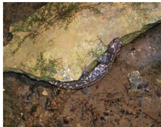
◀石鎚産コガタブチサンショウウオの成体(生息の有無は自然のパロメーターです!)

日本の小型サンショウウオ全二十八種の中で、もっとも美しいとされているコガタブチサンショウウオ(写真、石鎚産)。全長8〜12センチ。背中の黄褐色の斑紋が鮮やかで素敵です。石鎚山、剣山にかかる四国山脈に分布しており、町内では面河、柳谷両地区で見つかっています。2008年、京大グループによる系統分類学的な調査結果から四国産のものは独立種とされました。しかし石鎚以外の産地では斑紋のパターンが異なるなど地理的な変異が