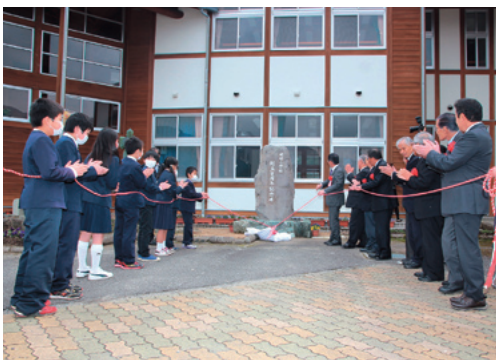
記念碑の除幕を行う参加者と児童の皆さん

記念行事では、久万中学校・上浮穴高校吹奏楽部による合同演奏やビデオレターなどを上映。その後、玄関横に建てられた記念碑の除幕を行いました。