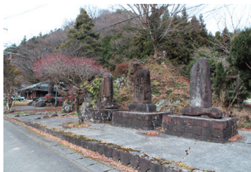
ほたる交流館近くにある石碑

現在は18戸皆で協力や相談をし、コミュニケーションを図り、自治活動を行っています。組名と同様に永久に続くことを願って…。