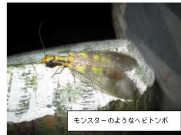
セミの幼虫(若虫)のヘビトコ

夜の生き物を探して久万公園を歩き回ります。夜は昼間には隠れてしまっているがやもなどの生き物が活発に動き回ります。夜にしか見ることのできない昆虫の羽化は必見。中でも、セミの羽化の様子は感動するはず。昆虫以外にもカエルやヘビ、カナヘビの夜の姿を観察できるかも。