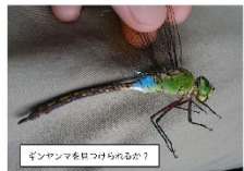
ゲンヤンマを採集する様子

※モンゴクラブは月1回開催する久万高原町民の生物観察会。毎回の企画ごとに参加者を募集しています。イベントの案内は町広報や体験HP、SNS等で掲載されています。地域の自然や文化を知る様々な活動にぜひご参加ください。