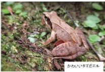
かみいりすずがニホ

標榜の面河溪を歩いて山頂に住むカエルを観察します。渓流にはタゴガエルやカジガエルなど、途中で見られないカエルがいっぱい。道が良ければヒキガエルに出会えるかも。久万高原町のカエルについて、もっと知ってみましょう！