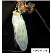
羽化したセミの若虫

※モンゴクラブは月1回開催する久万高原町民の生物観察会。毎回の企画ごとに参加者を募集しています。イベントの案内は町広報や体験HP、SNS等で掲載されています。地域の自然や文化を知る様々な活動にぜひご参加ください。