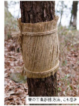
樹木のこも巻きの方法、こも巻き

久万公園で冬越しをする昆虫を観察します。樹木に設置した「こも巻き」や、樹皮、落葉の下などは冬越しする虫たちの隠れ家。中には普段見つかからない珍しい昆虫が見つかることも。寒さの厳しい久万高原の冬。冬を乗り切る虫たちの姿をのぞいてみましょう。