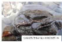
ヒキガエルをいれたい袋のカエル

※モンゴクラブは月1回開催する久万高原町民の生物観察会。毎回の企画ごとに参加者を募集しています。イベントの案内は町広報や体験HP、SNS等で掲載されています。地域の自然や文化を知る様々な活動にぜひご参加ください。