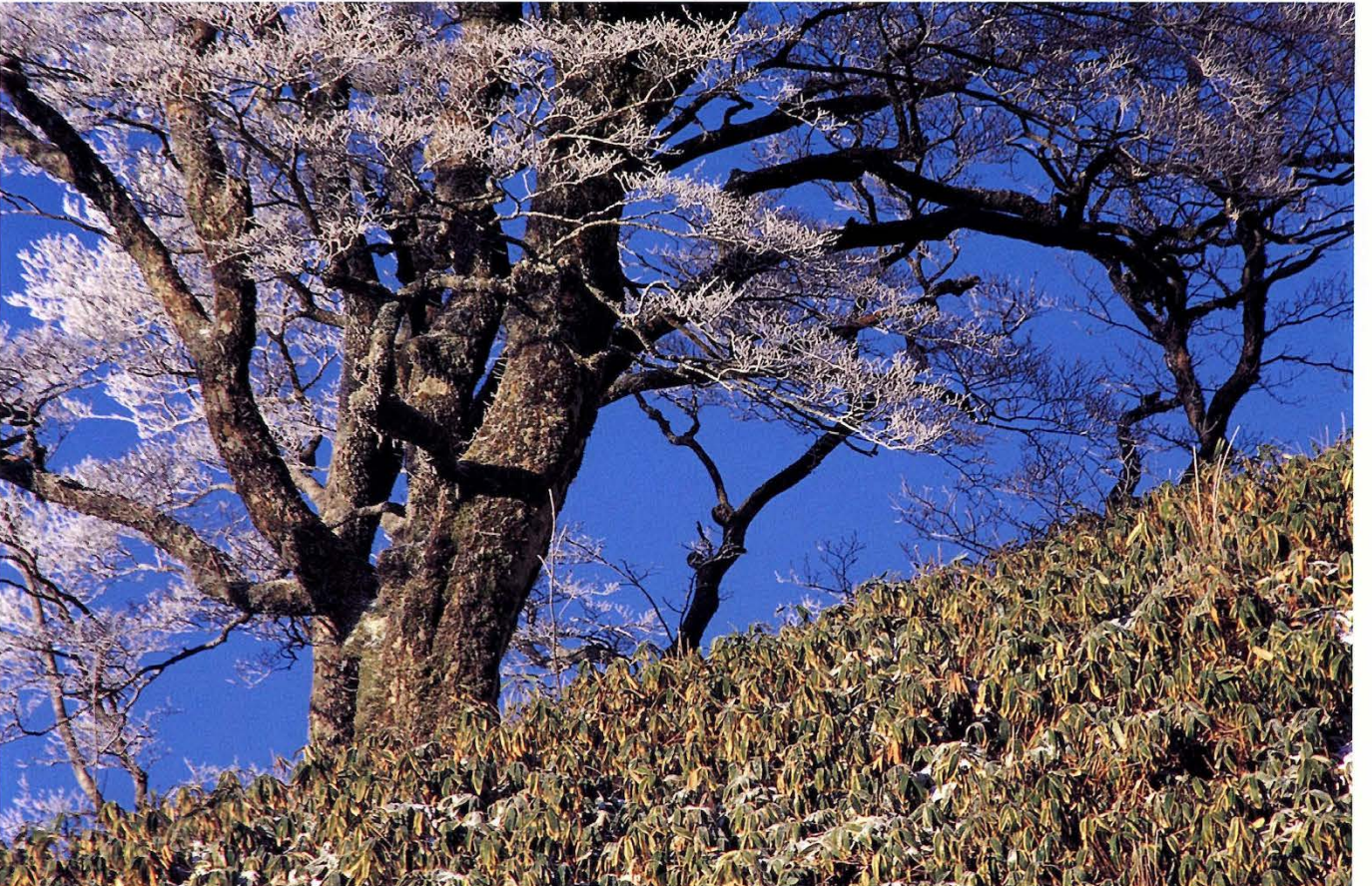
ブナ冬越し(伊豆ヶ谷)