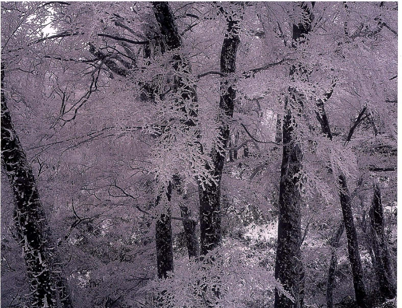
厳しい冬(伊豆ヶ谷)