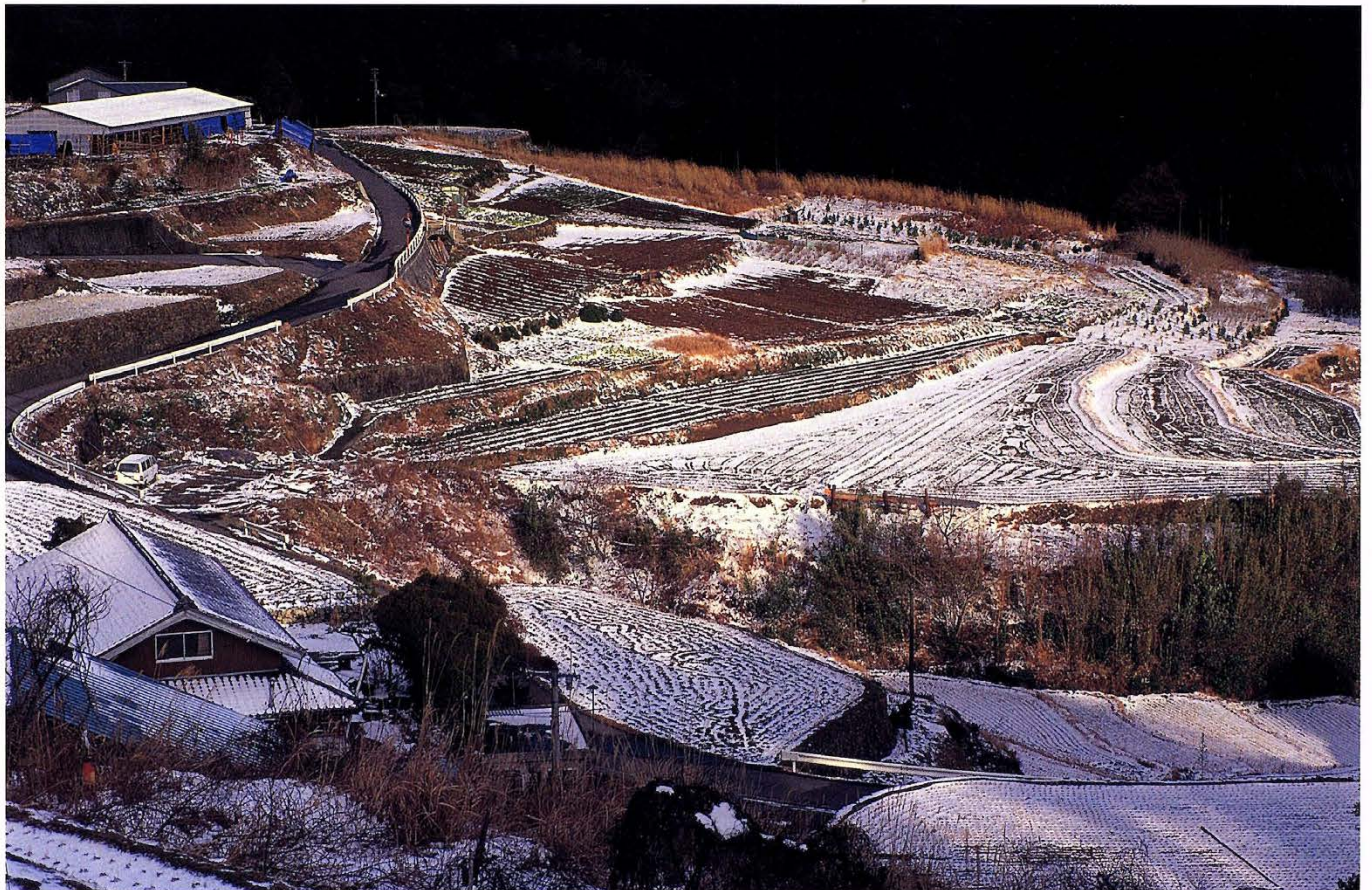
ゴウノソ地域の田んぼ