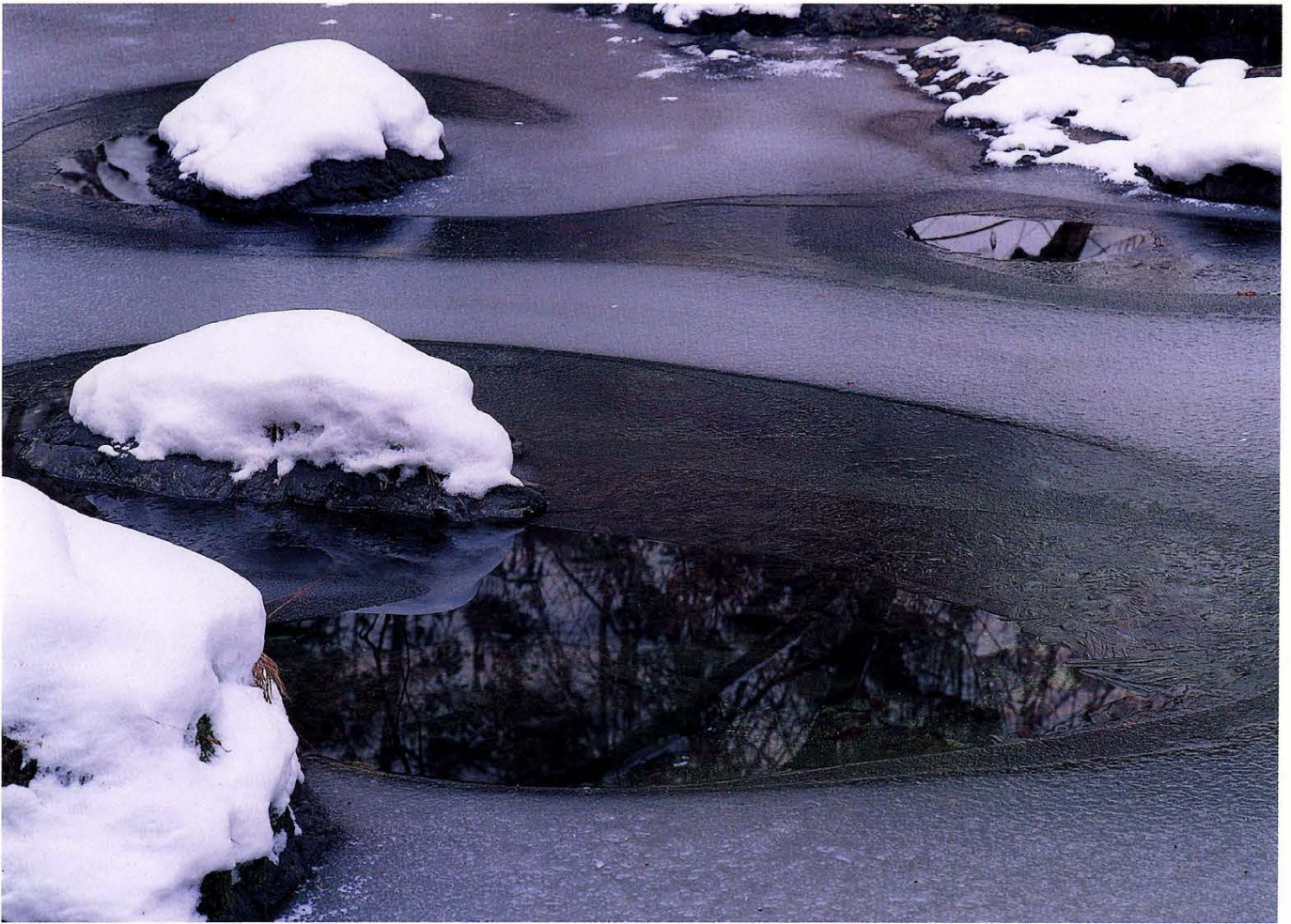
谷間の雪模様 (中久保川)