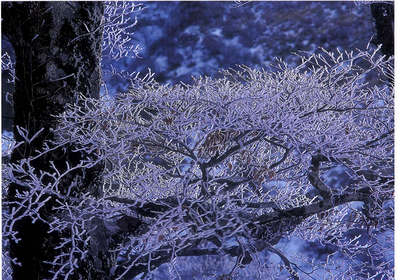
ブナの樹氷(伊豆ヶ谷)