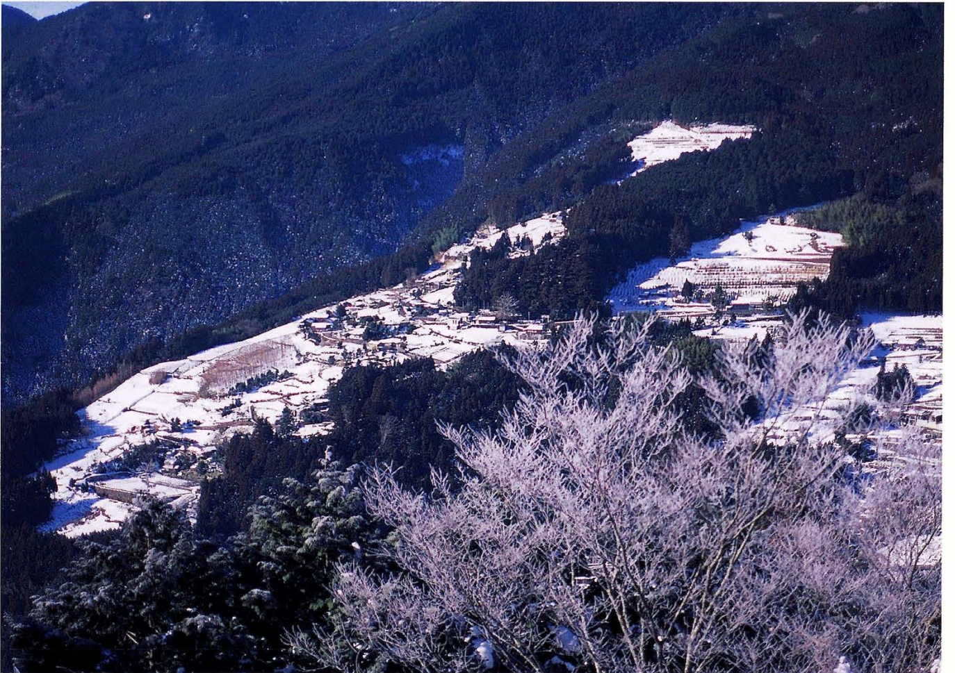
本村 (松木・川前・大窪谷)