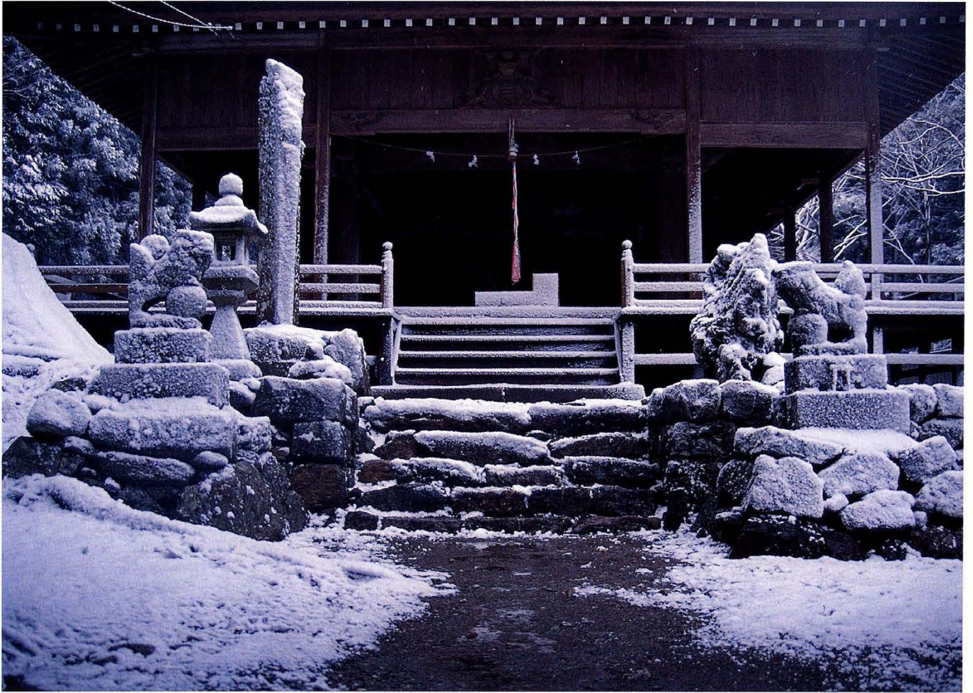
大宮八幡神社 (中津)