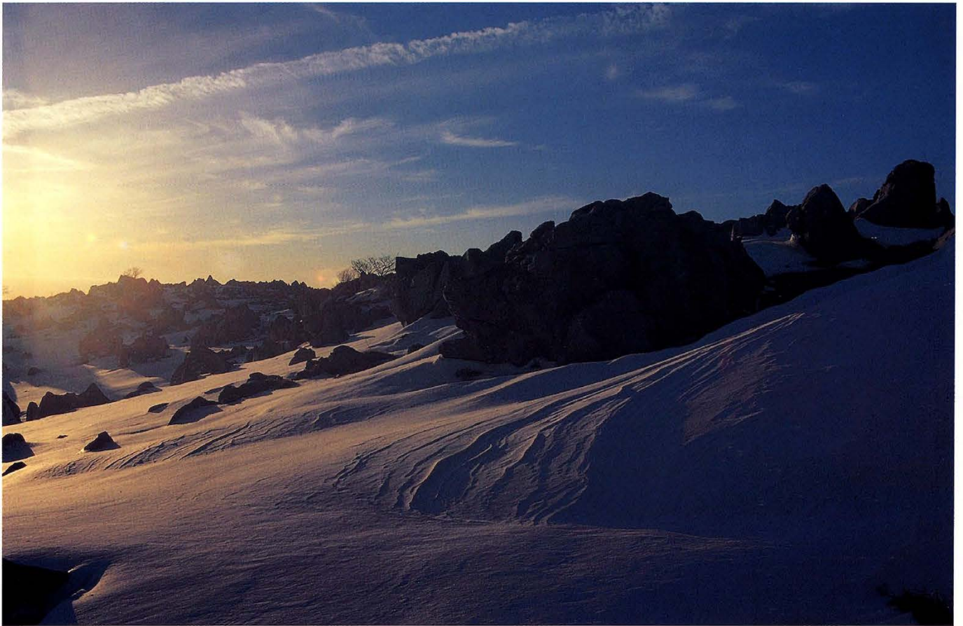
夕日を受けて(四国カルスト)